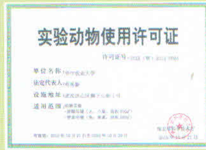
实验动物使用许可证