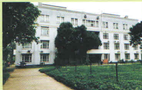
华中农业大学实验动物中心