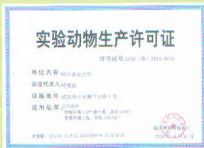
实验动物生产许可证