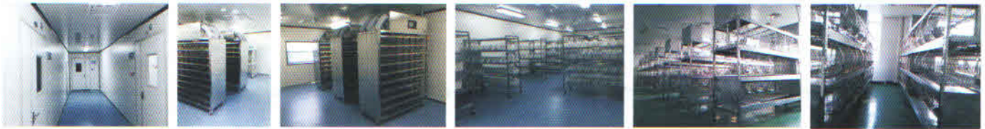
屏障环境实验区走廊 IVC独立通风笼架

本中心为教学、科研等提供羊、牛、禽等购买及饲养管理服务，提供各类大动物的实验管理。